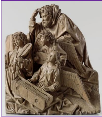
Maria, Jozef en de drie engelen van Adriaen van Wesel, omstreeks 1475-1477