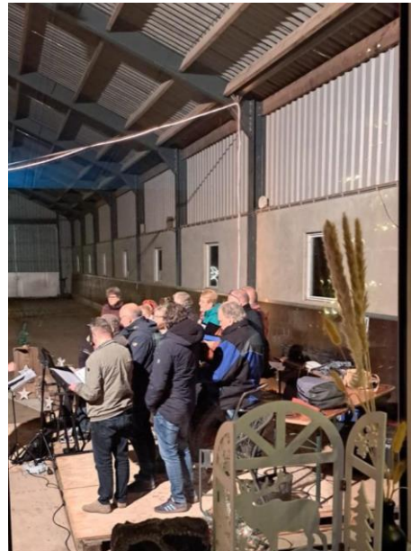
Kerstaviewing H. Antonius Abtkerk